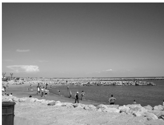
Photo 6 People relaxing on the beach, Provence. (プロヴァンス地域の海岸で寛ぐ人々)

また、どの温泉でも、源泉の位置と深度、泉温については問い合わせが必要であったのに比べ、温泉の成分表は受付に掲示しており、温泉療法のうえで成分 (Table 1) を重視しているようであった。これらの温泉を利用する人々にとっては、温泉成分が明確であることが温泉療法の必須条件であると考えられる。いわば、効果のあるミネラル等の成分が含有された治療薬である「温泉」を使用して、特定疾患を治療することが、プロヴァンス地域の人々の、温泉に対するイメージなのだろう。