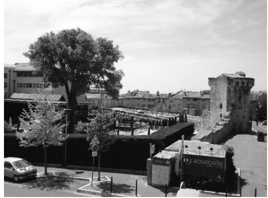
Photo 4 Overview of Thermes Sextius, Aix en Provence. (エクス・アン・プロヴァンスのセクスティウス温泉全景)

以上に紹介したプロヴァンス地域の温泉のうち、グレウー・レ・バンとディーニュ・レ・バンの 2 ヶ所は、主に医療目的で使用されている。両温泉とも、利用者は呼吸器系やリュウマチの慢性疾患を持った人々が大部分である。温泉を経営するどちらの民間組織も、「医師が処方する近代医学の療法」であり、「自然に基づく医療 (Medicine Naturelle)」でもあるとの付加価値を、温泉治療に持たせている。また、どちらの施設でも一般客に開放している温泉利用法があるが、観光客や地元民を惹きつけているとはいえないようである。外国や北仏からの観光客の多いエクス・アン・プロヴァンスにおいて、施設規模の割に入館客が少ないのは、治療目的の来訪者がいないことにも起因しているようである。プロヴァンスのフランス人にとっては、病気治療のためであればともかく、余暇や娯楽のために温泉に行くのは、価格的にもレジャーとしての楽しみにも欠けるようである。筆者も各施設の温泉プールもしくは温泉ジャグジーを使用してみたが、ただ漫然と浸かって楽しむには温度が低いため、日本の温泉のように楽しむことが出来ず、また運動や水泳をするのであれば、各種マシンを取り揃えたジムの方が楽しい、といった娯楽としての中途半端さを感じた。