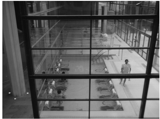
Photo 5 Aqua-gymnastics in Thermes Sextius, Aix en Provence. (セクスティウス温泉内の運動用プール)